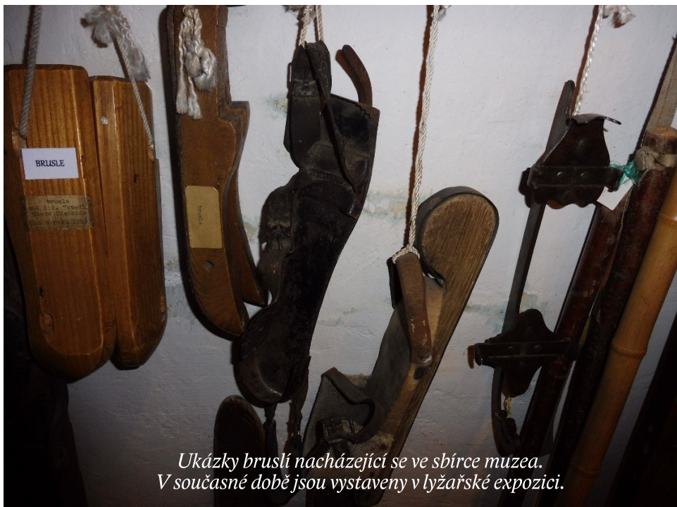
Ukázky bruslí nacházející se ve sbírce muzea. V současné době jsou vystaveny v lyžařské expozici.

Jelikož na bruslení nevzniklo žádné vhodné oblečení, tak se ženy i muži pohybovali po kluzišti v oděvu, jako kdyby šli na městské korzo. Na kluzišti stejně jako při procházkách městem panovala mezi bruslaři společenská a módní pravidla. Ženy nosily kostýmky s dlouhou sukní, na nich kabátky a na hlavě černý klobouk. Oproti tomu pánové na tom byli podstatně lépe. Nosili praktičtější oblečení, které bylo tvořeno oblekem a vestou. Na tomto obleku měli teplé zimníky s kožešinovým límcem. Na hlavách nosili buřinky, takže ani oni nemohli dělat žádné piruety. Tato secesní móda, především ta ženská, nebyla pro sport praktická, ale i tak můžeme zmínit jeden módní doplněk, který byl užitečný v tomto zimním