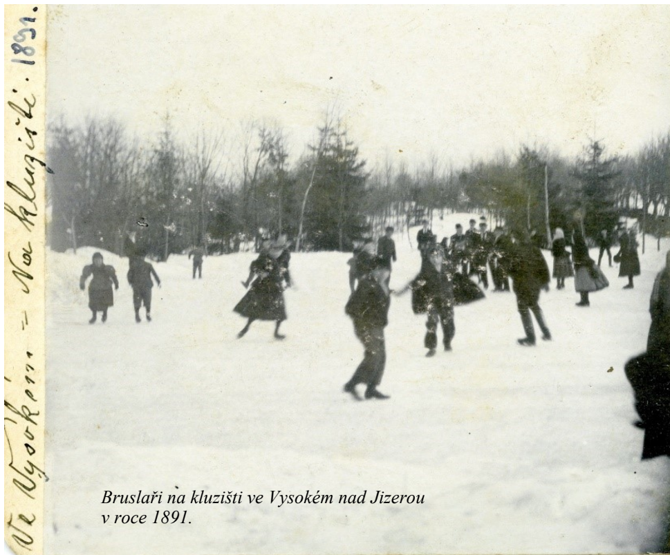
Bruslaři na kluzišti ve Vysokém nad Jizerou v roce 1891.