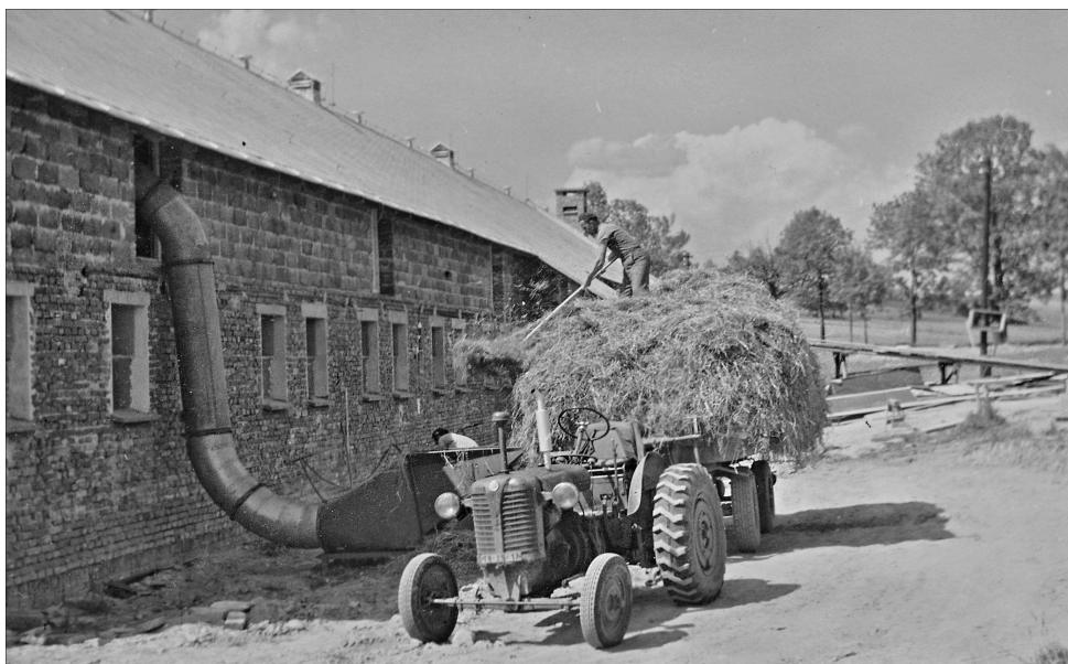
První seno do kravína