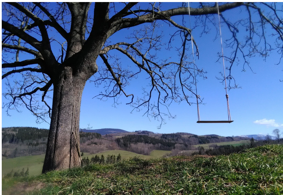
Jilemnice - houpačka Jasanka

hřeben mezi Horní Kalnou a Kunčicemi nad Labem. Zde také zažijete nadpozemské zhoupnutí a jedinečné výhledy na „Houpačce u kříže mezi lany“. Dokonce i dvě „Houpačky v aleji“ na