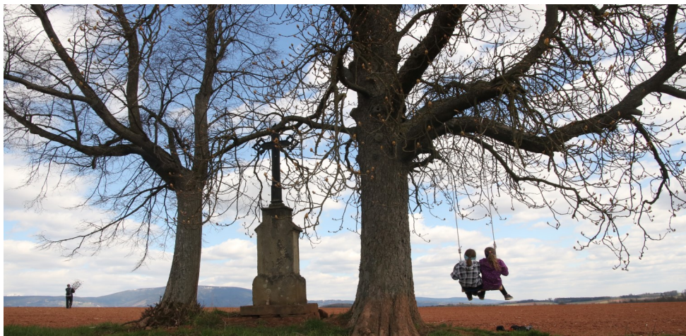
Horní Kalná - Houpačka u kříže mezi lany

na Kotelní jámy si vychutnáte, když se za houpačkou vypravíte po Cestě Havlase Pavlaty. Jirovec a lípa nad Horní Kalnou , které jsou chráněny osamělým křížem, potkáte při cestě na