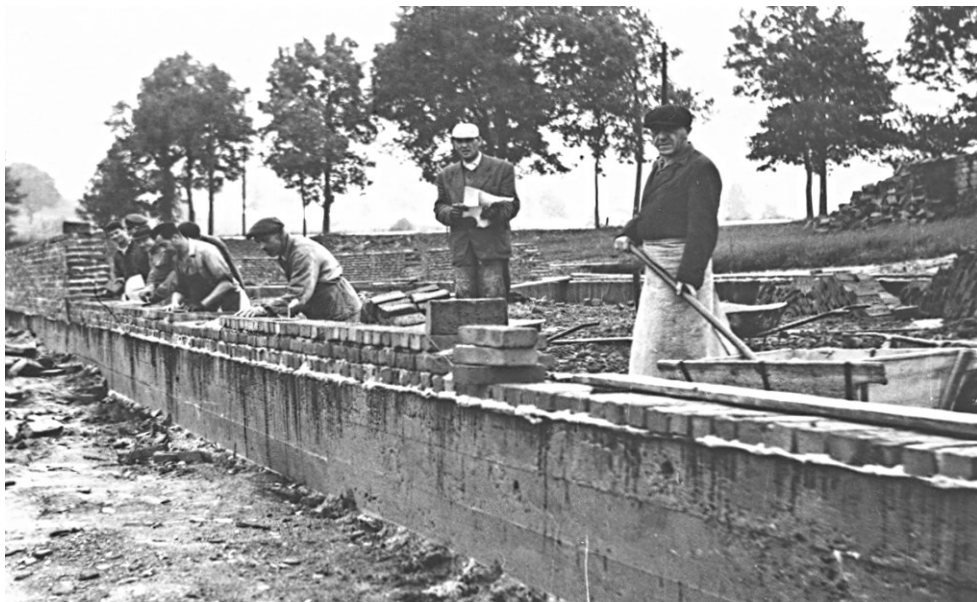
Stavba kravína 29. 6. 1958