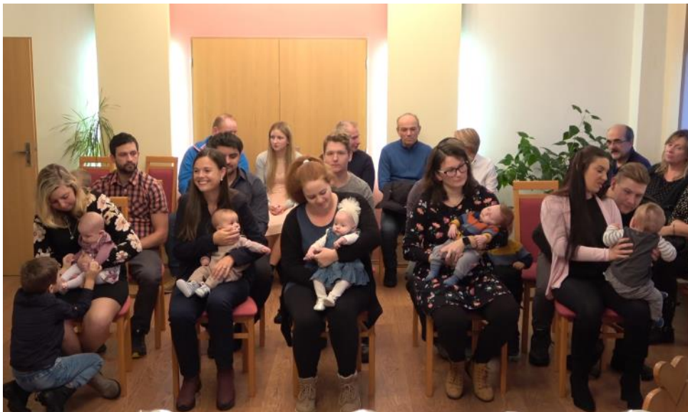
Vítání občáňků dne 4. 12. 2023