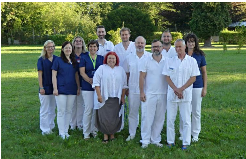
Kolektiv vysokých lékařů v roce 2025.