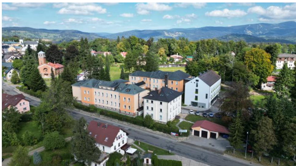
Letecký snímek Ústavu z roku 2023.

Požizování nejmodernějších přístrojů, bez nichž se dnes kvalitní zdravotní péče neobejde, je pro každou nemocnici velkou finanční zátěží. Ani Ústav chirurgie ruky a plastické chirurgie není výjimkou. Právě proto má velký