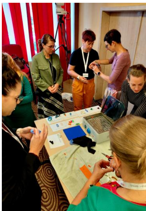
Tým vysokých fyzioterapeutek během workshopu „Za málo plastu hodně muziky“ ukazoval zájemcům, jak se vyrábějí dlahy z nízkoteplotního plastu.