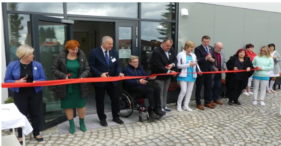
Slavnostní otevření nového pavilonu E, které se uskutečnilo v rámci dne otevřených dveří 17. října 2023.

Nový pavilon E byl tak po mnoha peripetích dokončen 5. března a zko- laudován až 30. června 2023, tedy po dvou letech od zahájení výstavby. Prv- ního září téhož roku začal sloužit paci- entům i personálu. Od prvotního zá- měru až po samotnou realizaci tak uplynulo téměř devět let. Celková cena stavby pavilonu dosáhla 90,5 milionu korun, přičemž téměř 60 milionů bylo hrazeno z dotace Ministerstva zdravot- nictví ČR. Liberecký kraj přispěl část-